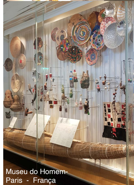
Museu do Homem - Paris - França