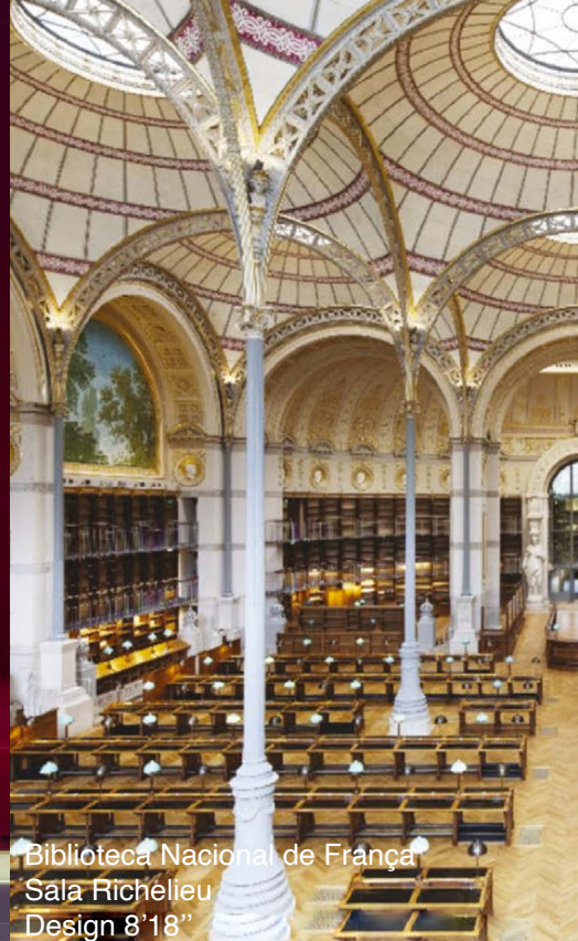
Biblioteca Nacional de França Sala Richelieu Design 8'18"