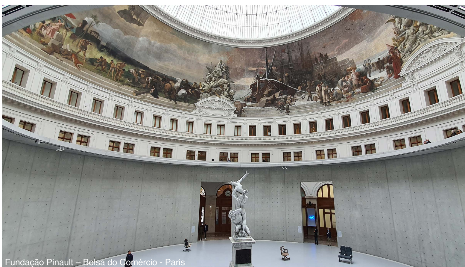
Fundação Pinault – Bolsa do Comércio - Paris