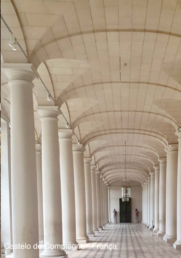
Castelo de Compiègne – França