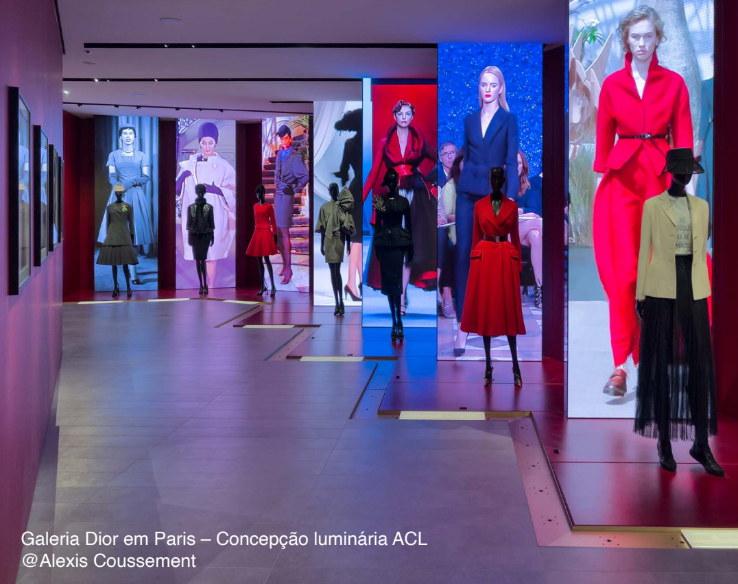
Galeria Dior em Paris – Concepção luminária ACL @Alexis Coussement