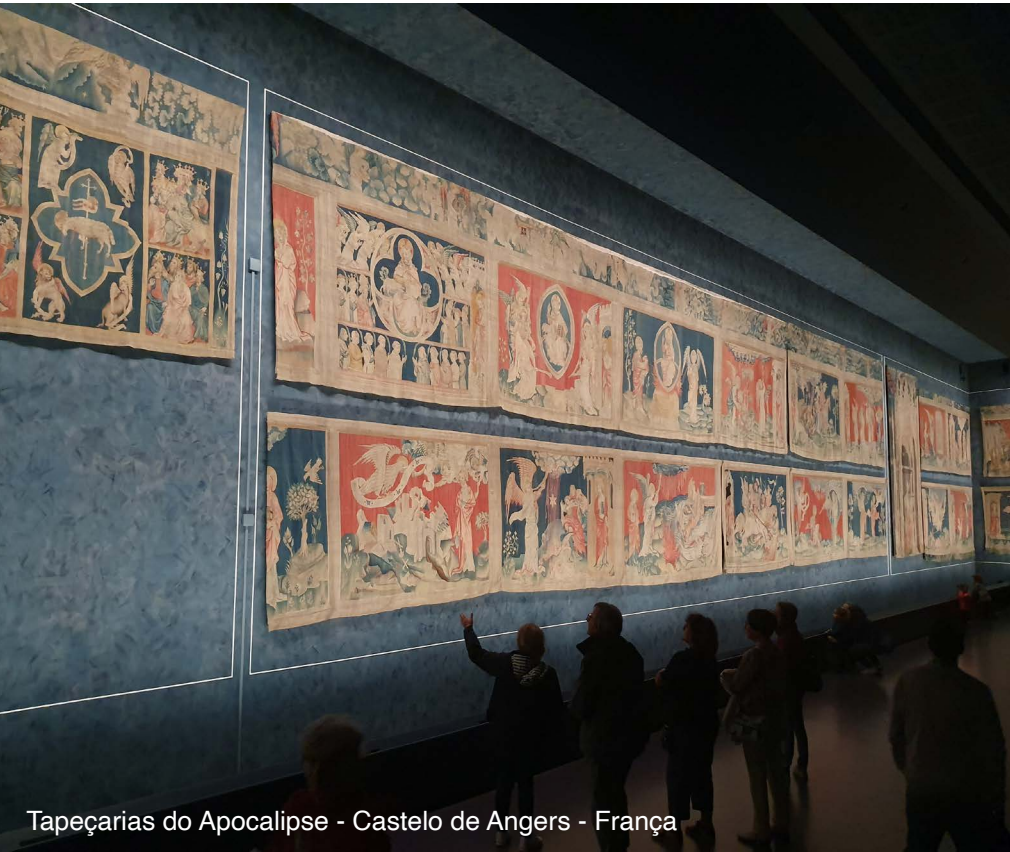
Tapeçarias do Apocalipse - Castelo de Angers - França