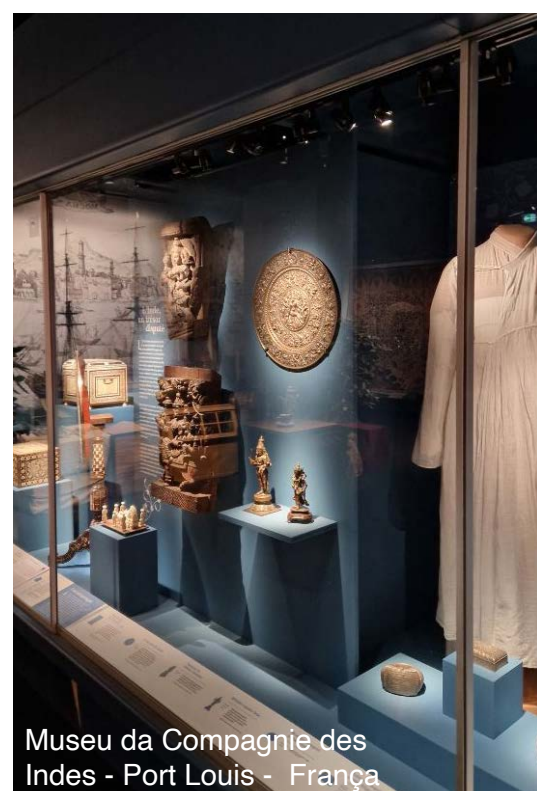
Museu da Compagnie des Indes - Port Louis - França