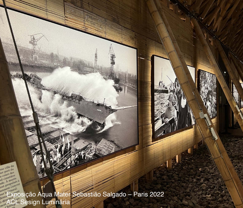
Exposição Aqua Mater Sebastião Salgado – Paris 2022 ACL Design Luminária