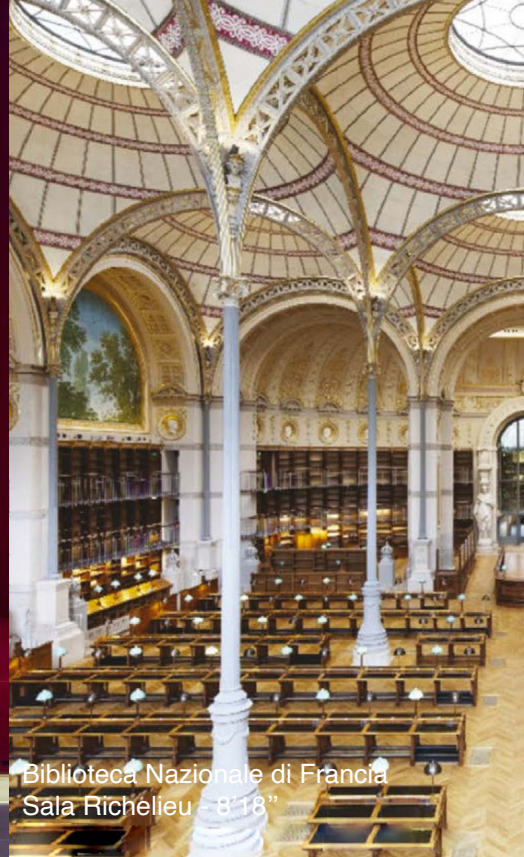
Biblioteca Nazionale di Francia Sala Richelieu - 8'18"