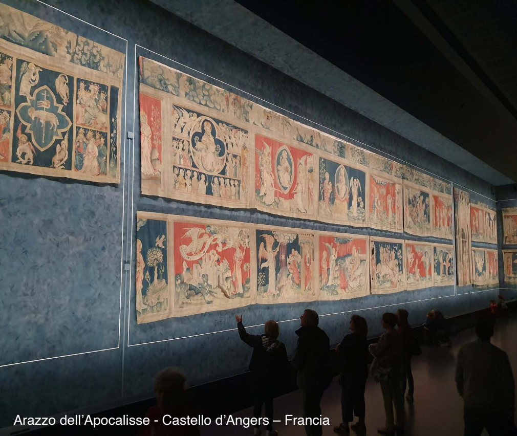
Arazzo dell'Apocalisse - Castello d'Angers – Francia