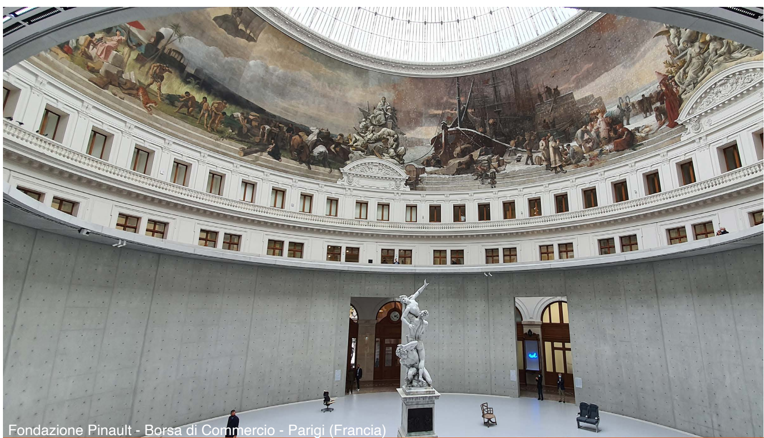
Fondazione Pinault - Borsa di Commercio - Parigi (Francia)