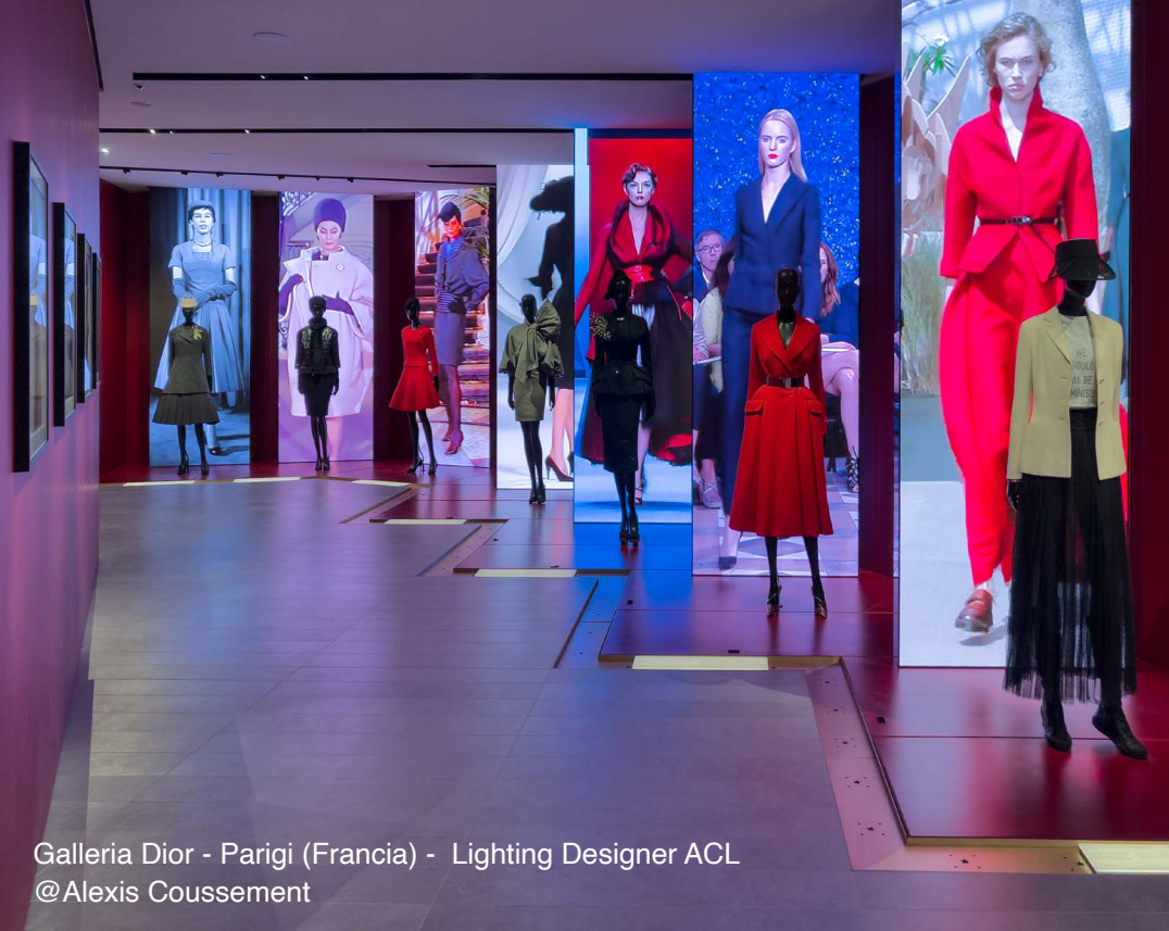
Galleria Dior - Parigi (Francia) - Lighting Designer ACL @Alexis Coussement